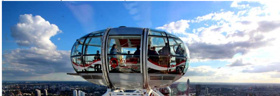
Капсула «Всевидающего Ока»

И вот мы у цели. Перед нами огромное, очень похожее на велосипедное колесо сооружение. В центре оно стянуто с ободом «колеса», словно спицы, мощными стальными канатами. Но в отличие от привычного нам «Колеса обозрения» вместо кресел к круглому ободу «колеса» прикреплены стеклянные кабины, очень похожие на огромные прозрачные капсулы. Каждая из них рассчитана на 20 человек. Забегая вперед скажу — эти «капсулы» защищают посетителя не только от дождя и ветра. В них независимо от времени года постоянно поддерживается комфортная для людей температура. Мало того — в самом центре кабины расположена широкая скамья, где практически могут разместиться все посетители. Хотя многие располагаются у окна, чтобы сохранить впечатление от посещения «Лондонского глаза» на долгие времена.