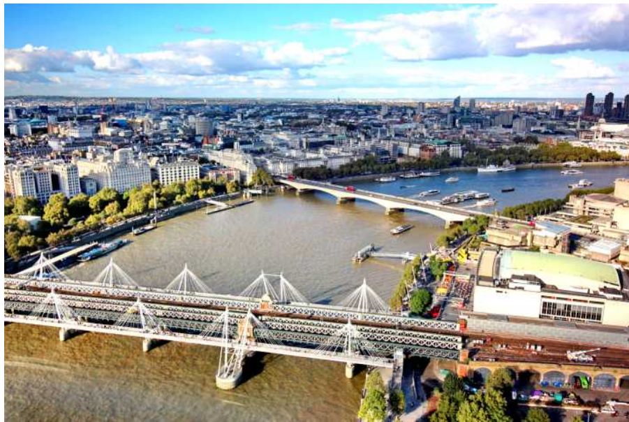
Панорама Лондона по обе стороны реки Темза. Снято с правой стороны капсулы.

Как нам потом стало известно, этих кабин ровно 32. Столько же — сколько и районов находится в Лондоне. Колесо обозрения настолько изящно и красиво, что сегодня столицу Англии уже просто невозможно представить без этого «Всевидающего Ока». Которое стало неотъемлемой частью города и удачно вписалось в городской пейзаж в самом центре городского района Ламберт на южном берегу реки Темзы. Кажется, этот аттракцион стоит здесь уже веками и без него уже просто невозможно представить Лондон так же, как и столицу Франции — Париж без Эйфелевой башни. Хотя этой знаменитой башне уже более 100 лет.